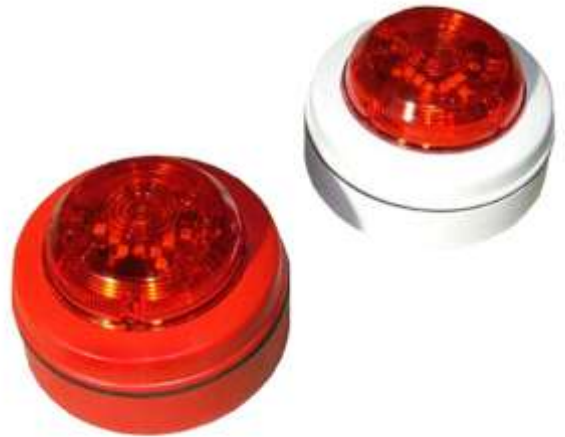
Рис. 2. Шлейфовая импульсная лампа BA-FOL

Необходимая частота мигания настраивается с помощью DIP-переключателей, устанавливаемых в положение «Slow» («Медленно») или «Fast» («Быстро»). По умолчанию установлено «Быстро». Кольцевая импульсная лампа BA-FOL доступна в красном и белом исполнении.