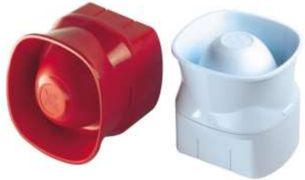
Рис. 1. Шлейфовая сирена BA-SOL

Максимальное количество устройств BA-SOL, которые можно подключить к кольцевому шлейфу, - 32. Это количество зависит от настроек громкости, параллельного использования других устройств, а также диаметра кабеля. Тональные сигналы «Медленно нарастающий», «Сигнал стандарта DIN» или «Непрерывный» устанавливаются непосредственно через приемно-контрольную панель пожарной сигнализации, даже в активном режиме работы, а необходимый уровень громкости настраивается с помощью DIP-переключателей, устанавливаемых в положение «Low» («Низкий») или «High» («Высокий»). Сирена BA-SOL доступна в красном и белом исполнении.